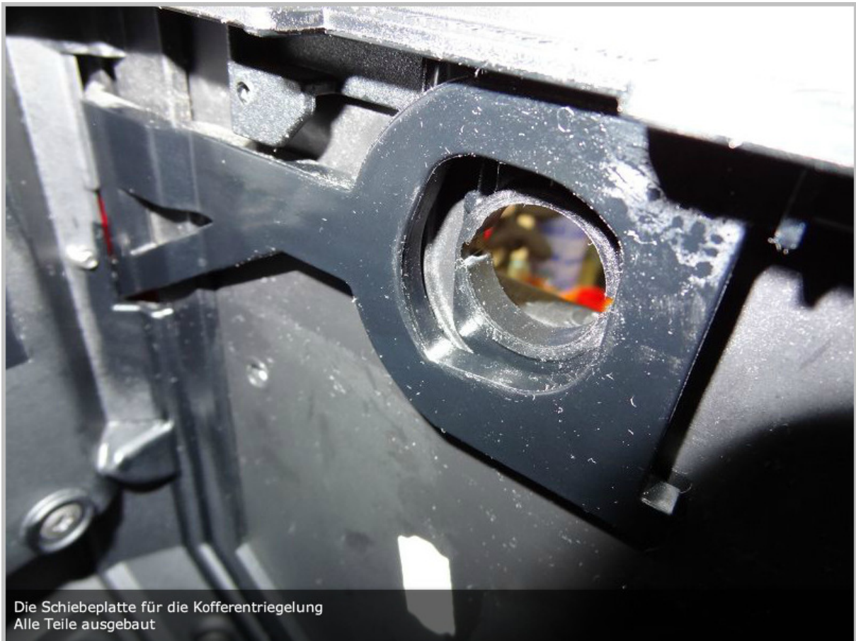
Die Schiebepatte für die Kofferentriegelung Alle Teile ausgebaut