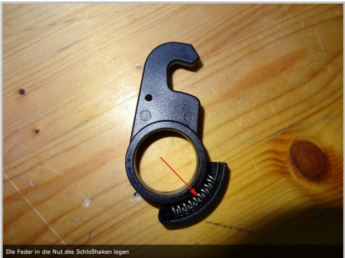
Die Feder in die Nut des Schloßhaken legen