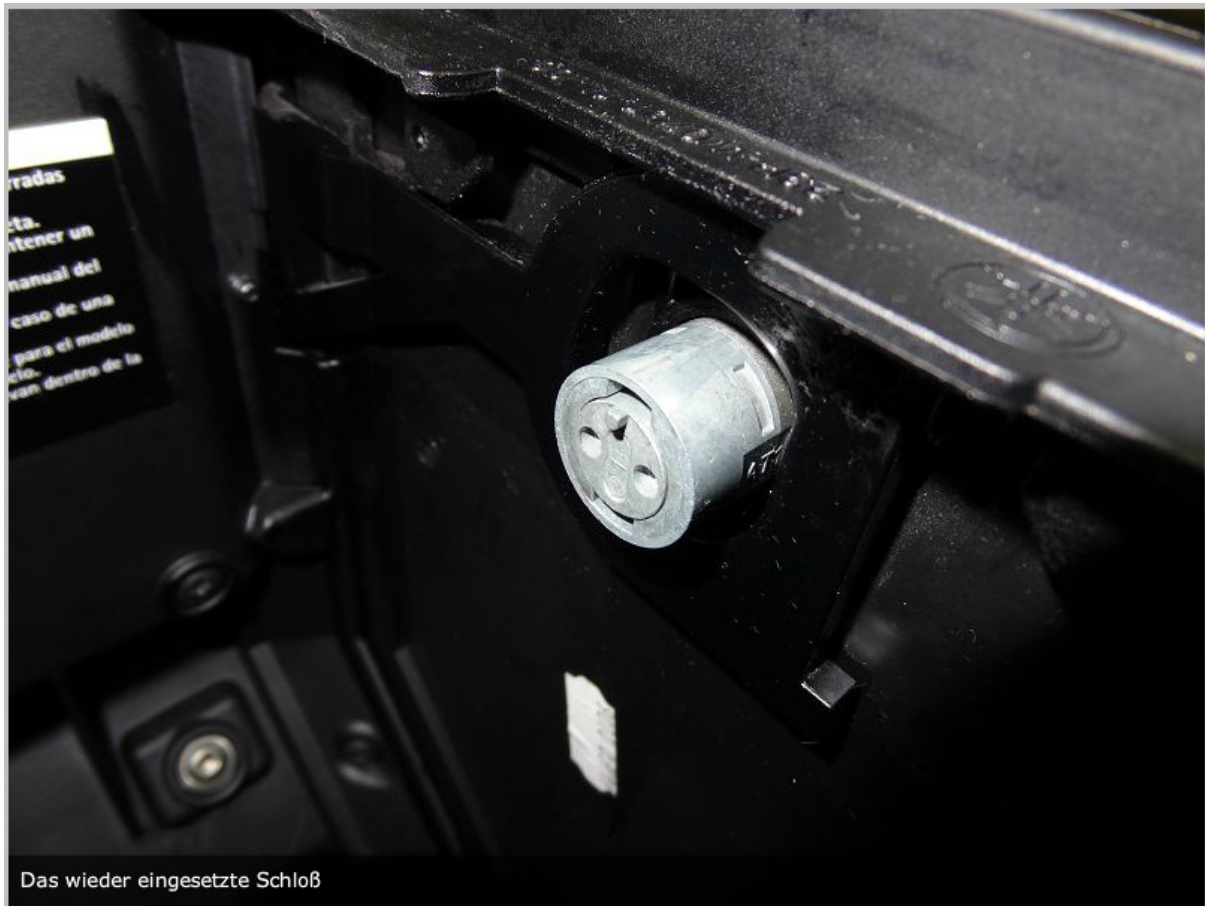
Das wieder eingesetzte Schloß